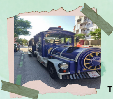
Tren en Tarragona

A continuación, unos decidieron dar un paseo por Tarragona y otros, aprovecharon para montar un trenecito, que daba un paseo por los lugares más emblemáticos de la población.