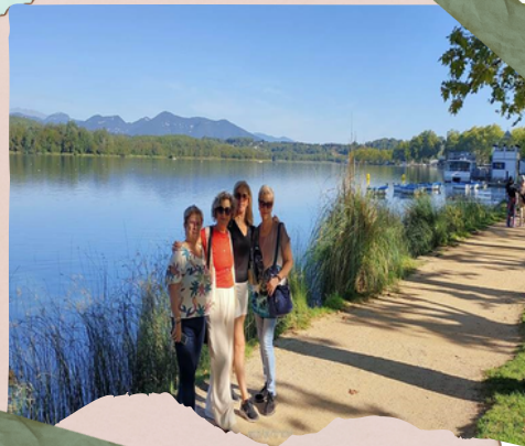
Lago de Bañolas

El lago de Banyoles es un espacio natural único, de gran valor geológico, ecológico, paisajístico y cultural. Se puede pasear y disfrutar de los rincones más emblemáticos o practicar numerosas actividades deportivas y de ocio en sus aguas y orillas.