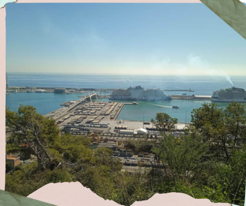
Cruceros en Barcelona