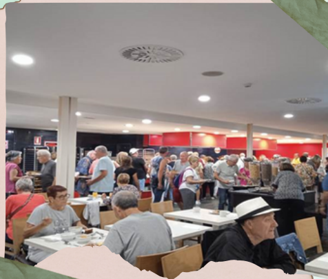
Interior del comedor

El miércoles, 27 de septiembre de 2023, la programación era visitar por la mañana el lago de Bañolas y Besalú. La distancia desde Lloret de Mar a estos lugares era de unos 70 km., ya no hubo que madrugar tanto.