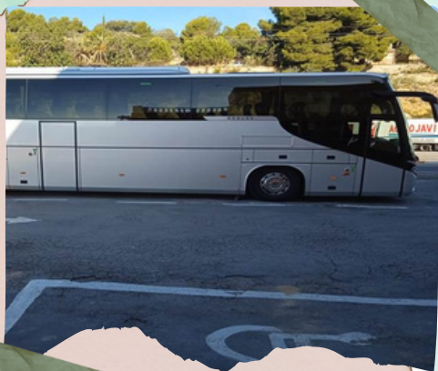
Autobús que nos trasladó durante todo el viaje

La salida estaba programada a las 05,00 horas. La gente, como en todos los viajes que se han realizado han sido puntuales. A los 05,02 minutos, el autobús partía hacia su destino. Las personas, con cara de sueño, pero con la alegría de compartir unos días de camaradería y de visitar nuevos lugares.