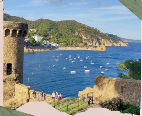
Desde las almenas

Después de dar un paseo por sus típicas calles y tomar un helado en la multitud de heladerías de la zona, marchamos de nuevo al hotel.