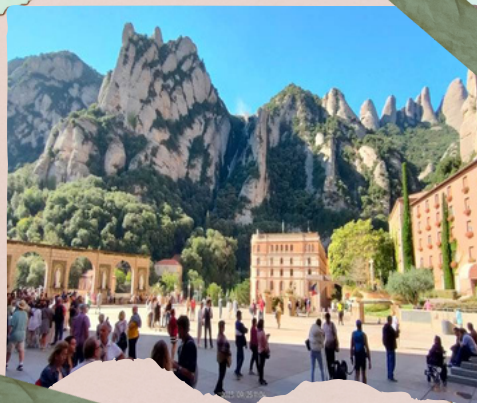
Visita de Montserrat