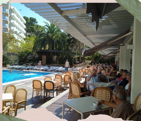
Piscina Partida de cartas

Después de la cena, algunas mujeres del grupo, echaban su partida de cartas, en una de las piscinas del hotel.