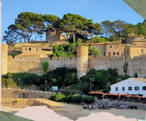
Vista del Castillo de Tolosa