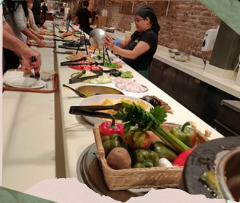
Restaurante "El Fresco"

A la hora de comer, fuimos al restaurante "Fresco", donde comimos bastante bien.