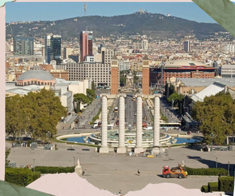
Vista de Barcelona

Hicimos una parada y nos llevó a ver un mirador donde se divisaba el puerto de Barcelona.