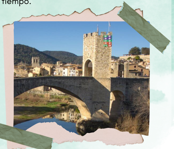
Puente de Besalú

Al llegar a las proximidades del pueblo, montamos en un trenecillo, que nos dio un recorrido por la población. Paramos en la iglesia de San Pedro, donde el conductor del tren, nos dio una explicación de la construcción de la iglesia y los acontecimientos más importantes ocurridos a lo largo de los años.