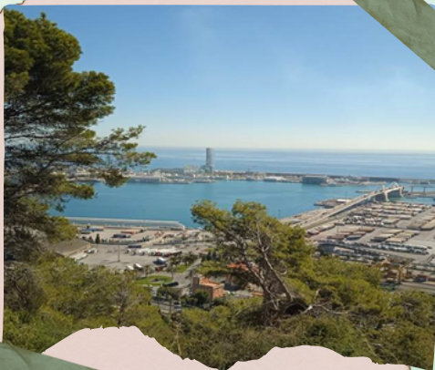
Puerto de Barcelona

Hicimos una parada y nos llevó a ver un mirador donde se divisaba el puerto de Barcelona.