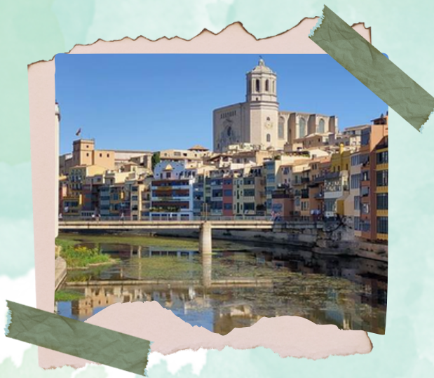
Vista de Gerona

El río Oñar atraviesa la ciudad dividiéndola en dos partes, en la orilla oriental se encuentra el "Barrio Viejo" y en la occidental el "Barrio de Mercadal". Ambos barrios están unidos por cuatro puentes, y a cualquiera que llegue a la ciudad, como nosotros, le cautivara las vistas que se obtienen al cruzarlos.