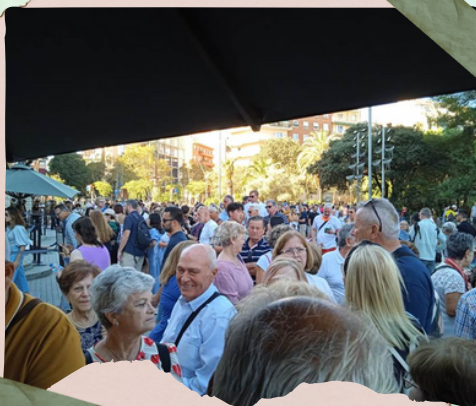
A las puertas de la Sagrada Família

Gaudí falleció en 1926 dejando inacabado el proyecto que ocupó los últimos años de su vida, pero, gracias a los planos que se conservan, su sueño se hace realidad poco a poco gracias al trabajo de otros artistas y al dinero obtenido a partir de las donaciones y las visitas.