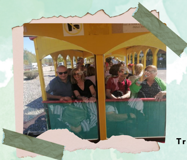
Tren de Besalú

Después de la visita, regresamos al hotel para comer y por la tarde, marchamos a visitar Tossa de Mar., que se encuentra a unos 11 km. de Lloret de Mar.