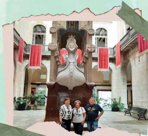
Paseo por Tarragona

A mediados del viaje, se le rompió una rueda al tren y tuvo que venir otro, para continuar el viaje que realizó sin novedad.