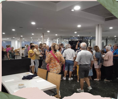
Cola para el café