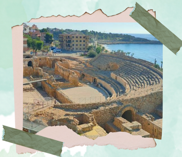
Anfiteatro Romano de Tarragona

El edificio está relativamente deteriorado, pero todavía podemos apreciar parte de su esplendor.