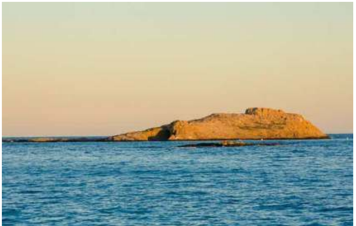
ISLA DE SAN ANDRÉS