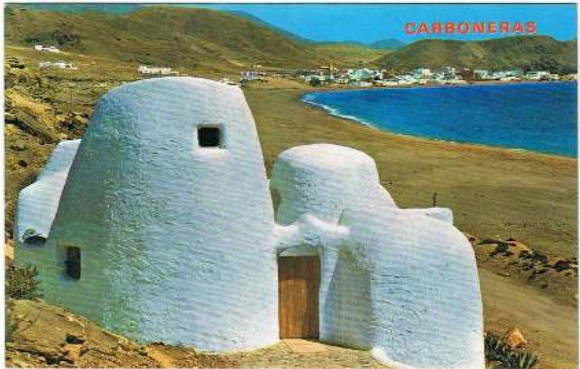
CASA LABERINTO EN CARBONERAS