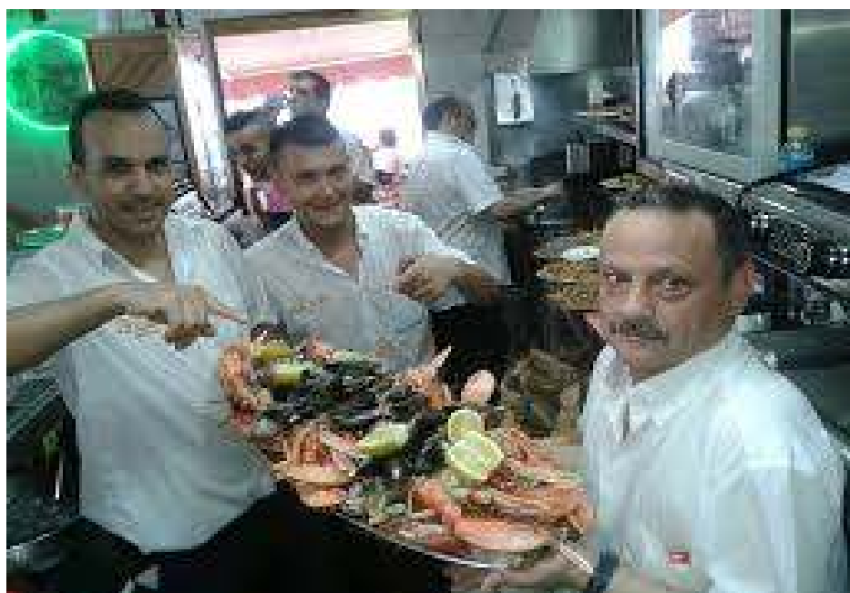
BAR FELIPE (CARBONERAS)

Una vez todos reunidos, a la hora acordada, después de saborear unas cervezas, marchamos al hotel-restaurant Las Palmas, donde teníamos concertada la comida.