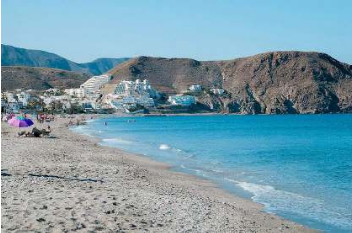
CARBONERAS: LA MAR DIVINA

Atrás se quedaban las playas de Carboneras, dejando el pensamiento de regresar otro día para visitar sus playas, su paseo marítimo, y algunas otras cosas que se quedaron en el tintero.