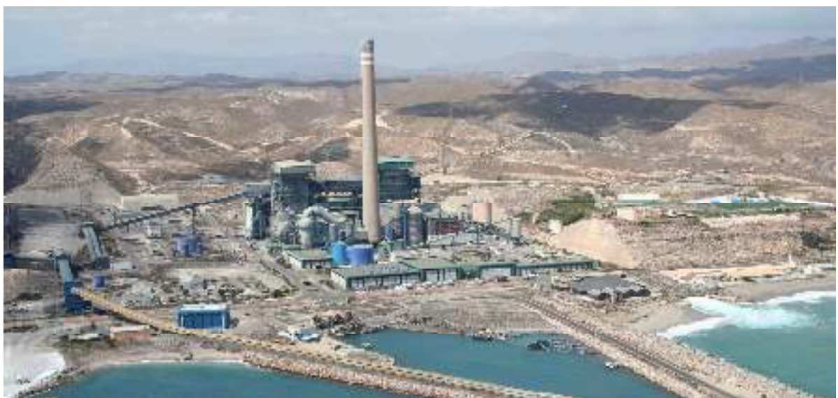
POLÍGONO INDUSTRIAL DE CARBONERAS.