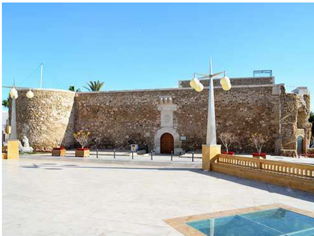
CASTILLO DE SAN ANDRÉS